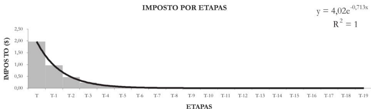
Gráfico 2 - Imposto gerado por etapa na cadeia produtiva (VA = 100%)

Nota-se que nas condições especificadas no exemplo, a cumulatividade gerada ao longo da cadeia de produção se exaure rapidamente, atingindo valor de apenas cinco centavos de real, R$ 0,05 , na etapa t-5, caminhando rapidamente para valores próximos de zero. Percebe-se, assim, que a acumulação de tributos ocorre com intensidade bem menos alarmante do que fazem crer os críticos dos impostos sobre movimentação financeira. Na etapa t-3 o valor do imposto corresponde a pouco mais de 5% da carga tributária total.